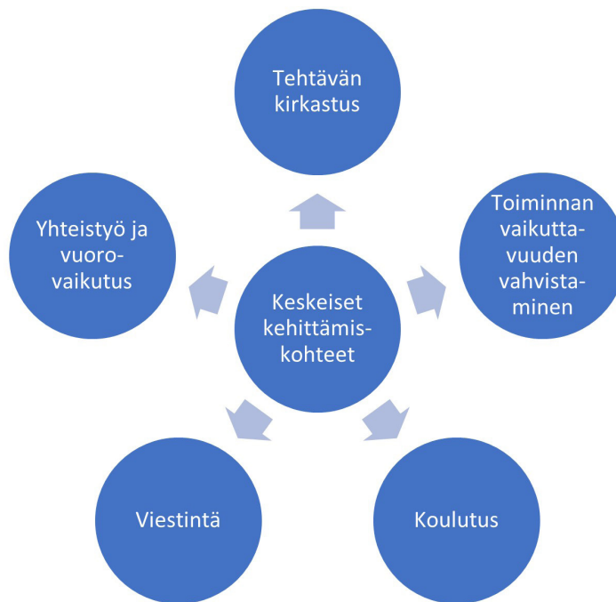
Kuvio 1. Vammaisneuvostojen keskeiset kehittämiskohteet Itä-Lapissa.

Osa-alueet on tärkeää huomioida vammaisneuvostojen toiminnan kehittämisessä ja esimerkiksi vammaisneuvostoille järjestettävissä koulutuksissa.